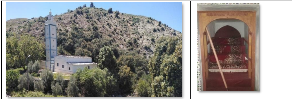
Photo 18 : La mosquée Qermoud . Sur son Minbar, il est inscrit 1921.