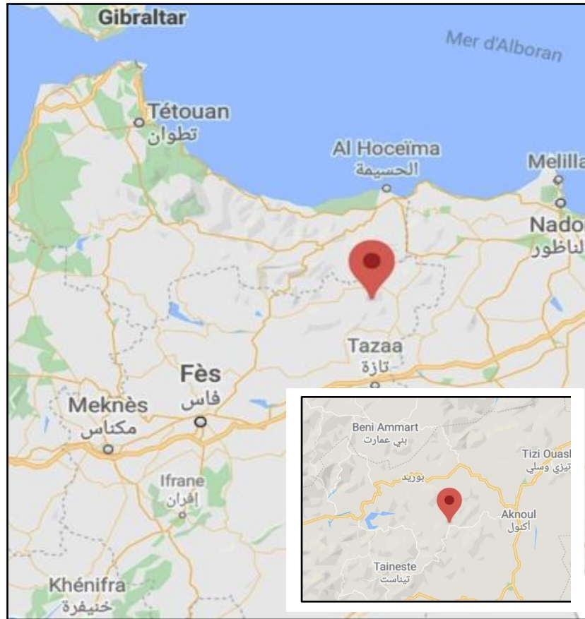
Figure 6 : Emplacement du souk Sebt Malal en rouge, à 22 km d'aknoul.