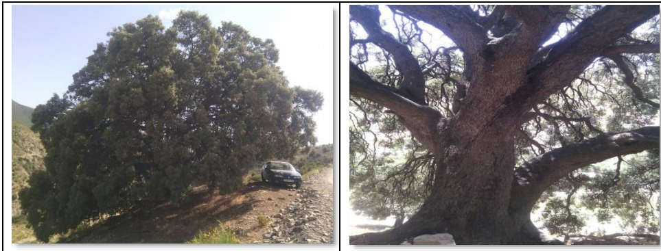
Photo 13 : Le chêne vert Tasافت Ou-charcheur , incarnat l'arbre mythique l'arbre du monde.